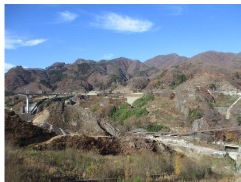
＜ハッ場ダム工事現場＞