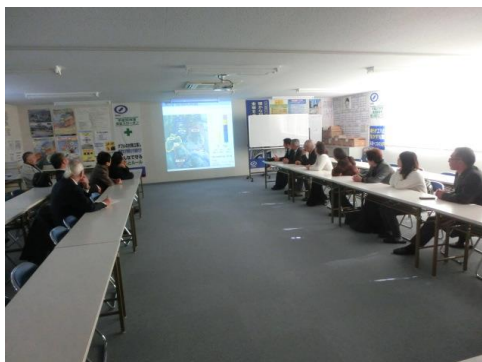
＜ハッ場ダム工事説明＞