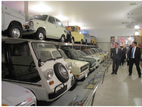
<おもちゃと人形自動車博物館>