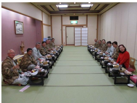
＜草津温泉 ホテル櫻井＞